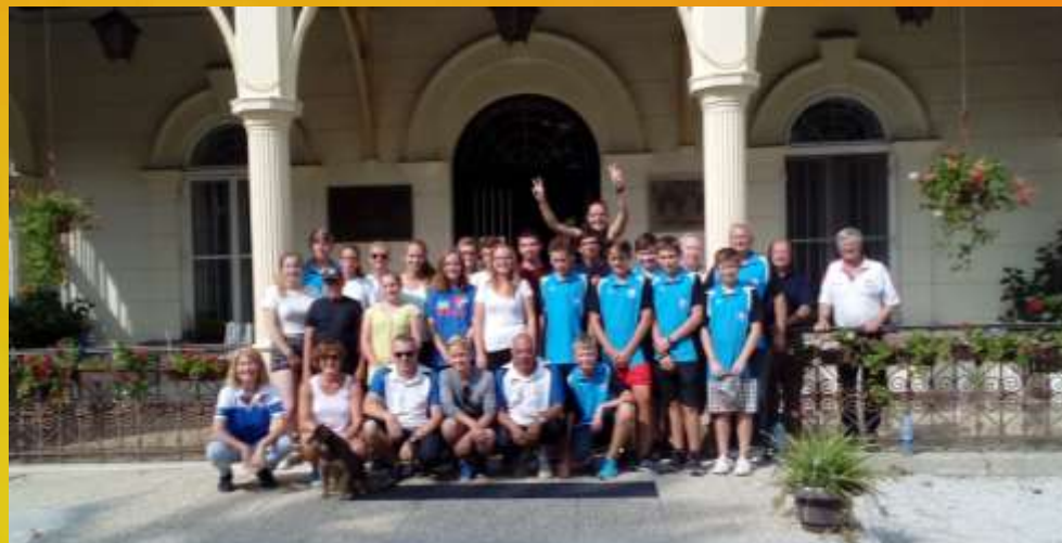
Dovidenia o rok, na 7. ročníku CAMP SLOVAKIA 2018